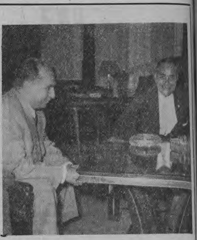
18 sierpnia 1958 r. przewodniczący Komitetu Planowania Gospodarczego przy Radzie Ministrów, Stefan Jedrychowski, przyjeżdżający do Polsce zastępcę sekretarza generalnego OZP, G. R. Bunche.

Wobec wielu osób. Ekipy prowadzące akcje ratunkowe przypuszczają, że pod zwalnią ziemi i kamieni znajduje się jeszcze kilkanaście ciał. Zwały ziemi obsunęły się do rzeki Madison niedaleko tamy Hebgen. Tam również została uszkodzona i istniejąca obawa, że nie wytrzyma naporu wody zgromadzonej w zbiorniku. Czynnione są przygotowania do ewakuacji ludności z doliny tej rzeki znajdującej się poniżej zapor.