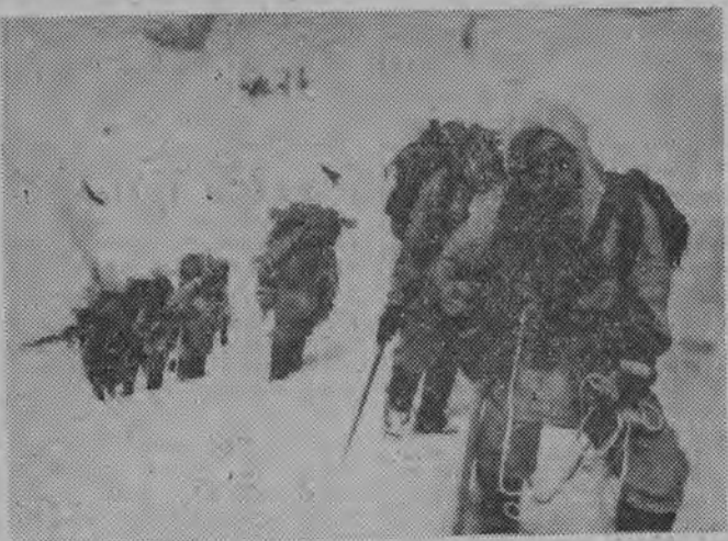
Wielkie zainteresowanie na świecie wzbudziła chińska ekspedycja wysokogórska na szczyt Muztagh Ata w Pamirze (wys. 7.546 m). NA ZDJĘCIU: członkowie ekspedycji w czasie wspinaczki.

BONN (PAP) 19. 8. 54 osoby zostały zabite, a 25 rannych w wyniku katastrofy samochodowej, która wydarzyła się niedaleko Darmstadt. Autokar wiozący studentów belgijskich i dzieci szkolne zderzył się na autostradzie z ciężnikiem z przezebra. Policja zakomunikowała że do wypadku autostrada Mannheim — Frankfurt była zamknięta przez kilka godzin, ponieważ ambulanse przewoziły rannych do szpitala. Studenti belgijscy wracali do domu z wycieczki do Tyrolu w Austrii.