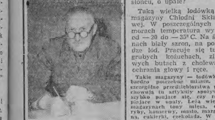
Tadeusz Kotarbiński — prezes Polskiej Akademii Nauk.