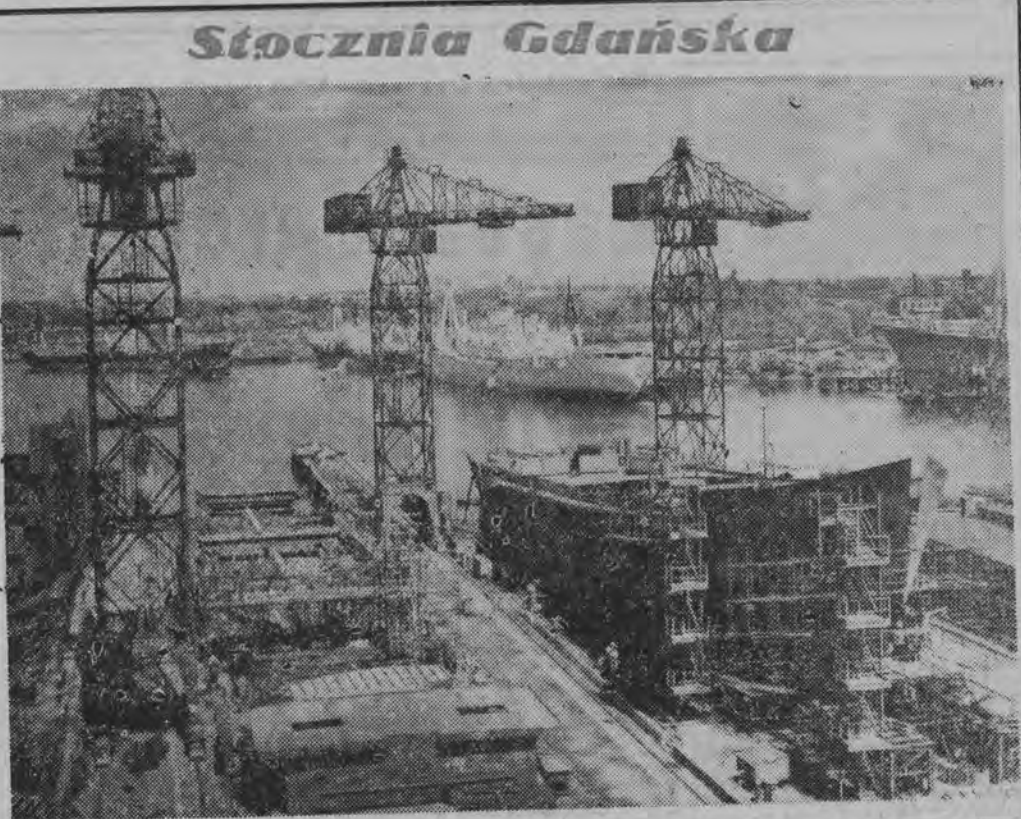
15-lecie Polski Ludowej Stocznia Gdańska — nasz największy producent stat- ków.

W Melun rozbił się w sobotę eksperymentalny aparat powietrz- ny konstrukcji francuskiej — ko- leopter. Koleopter startuje pion- owo poruszany śmigłami typu he- liopterowego, a następnie wleża normalne silniki. Katastrofa na- stała w momencie, kiedy apar- at wzniósł się na wysokość 70 metrów i kiedy pilot spostrzegł, że nie panuje nad maszyną. Zdo- łał się on uratować skacząc ze spadochronem, a maszyna rozbi- ła się na ziemi eksplodowała,