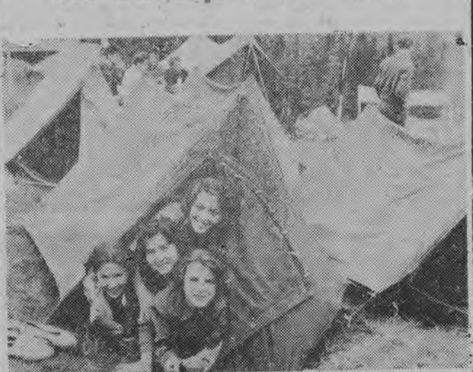
Młodzież bułgarska na obo- zie turystycznym na Wito- szu.