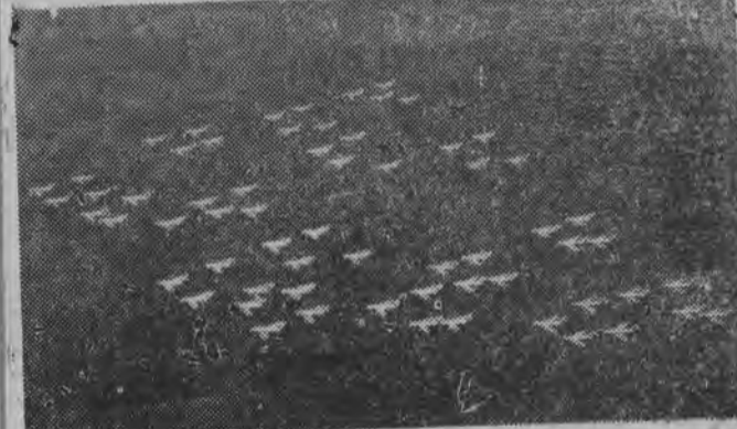
NA ZDJĘCIU: myśliwce w szyku defiladowym. Jest to „precyzyjnie utkany dywan” z samolotów odrzutowych. (Zdjęcia wykonano z odrzutowca).