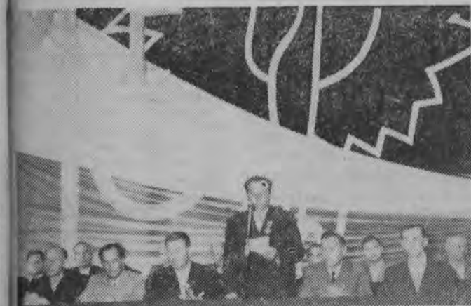
NA ZDJĘCIU: prezydium uroczystej sesji WRN, PRN i MRN w Białymstoku.