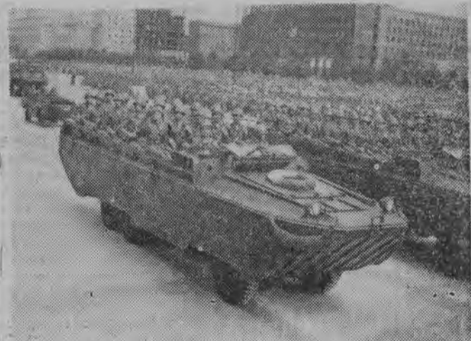
NA ZDJĘCIU: defilują wojska inżynierskie...

Zachmurzenie duże, możliwe przelotne opady. Po południu przejaśnienie. Temperatura od 18 do 24 st. C.