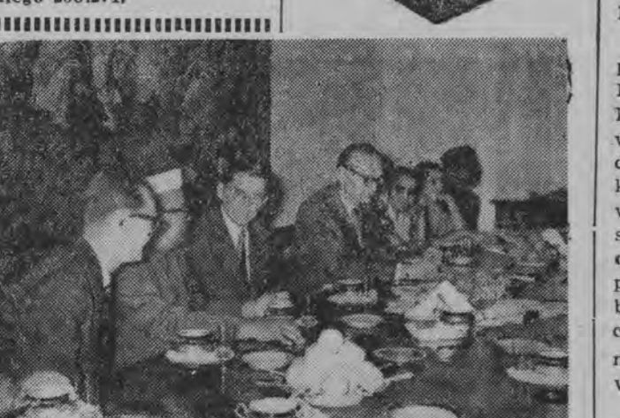
A ZDJĘCIU: delegacja parlamentu Indii podczas wjazdu do przewodniczącego Rady Państwa PRL Aleksandra Zawadzkiego.

Dwudniowe zawody zakończyły się zwycięstwem reprezentacji Wojska Polskiego 298:271.