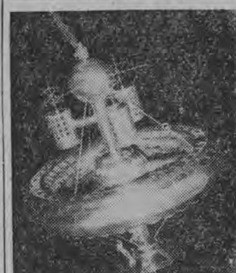
Na wystawie osiągnięć gospodarki narodowej ZSRR. W pawilonie „Elektryfikacja ZSRR” można obejrzeć działający model stacji kosmicznej.