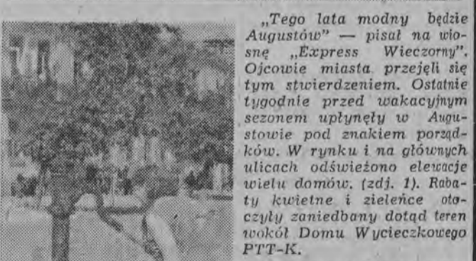
„Tego lata modny będzie Augustów” — pisał na wiosnę „Express Wieczorny”. Ojcowie miasta przejęli się tym stwierdzeniem. Ostatnie tygodnie przed wakacyjnym sezonem upłynęły w Augustowie pod znakiem porządków. W rynku i na głównych ulicach odświeżono elewacje wielu domów. (zdj. 1). Rabaty kwiatne i zieleńce otoczyły zaniedbany dotąd teren wokół Domu Wycieczkowego PTT-K.

Od wczesniej wiosny rozpoczęły się też prace remontowe (nareszcie) przy budynku zabytkowej poczty. Będzie się tu mieścić Oddział PTT-K i schronisko. Inwestycja w tym mieście jak najbardziej potrzebna (zdj. 2).