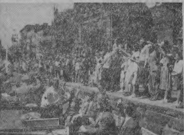
Kredytowani w Polsce członkowie korpusu dyplomatycznego wzięli udział w wycieczce zorganizowanej przez MSZ. Dyplomaci odwiedzili Gniezno, następnie Biskupin, Bydgoszcz, Toruń... NA ZDJĘCIU: w drodze z Bydgoszczy do Torunia — przejażdżka statkiem.