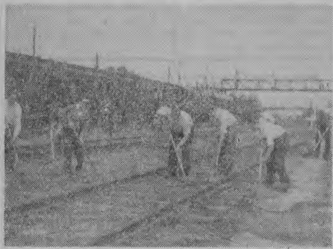
Zaloga stacji PKP w Białymstoku robi wszystko, aby wypaść jak najlepiej w konkursie „4 x najlepsza”. O czystości stacji świadczy przecież również porządek na torowiskach.

Przypominamy Czytelnikom, że konkurs „4 x najlepsza” trwa do 20 lipca br. Na uczestników czekają cenne nagrody