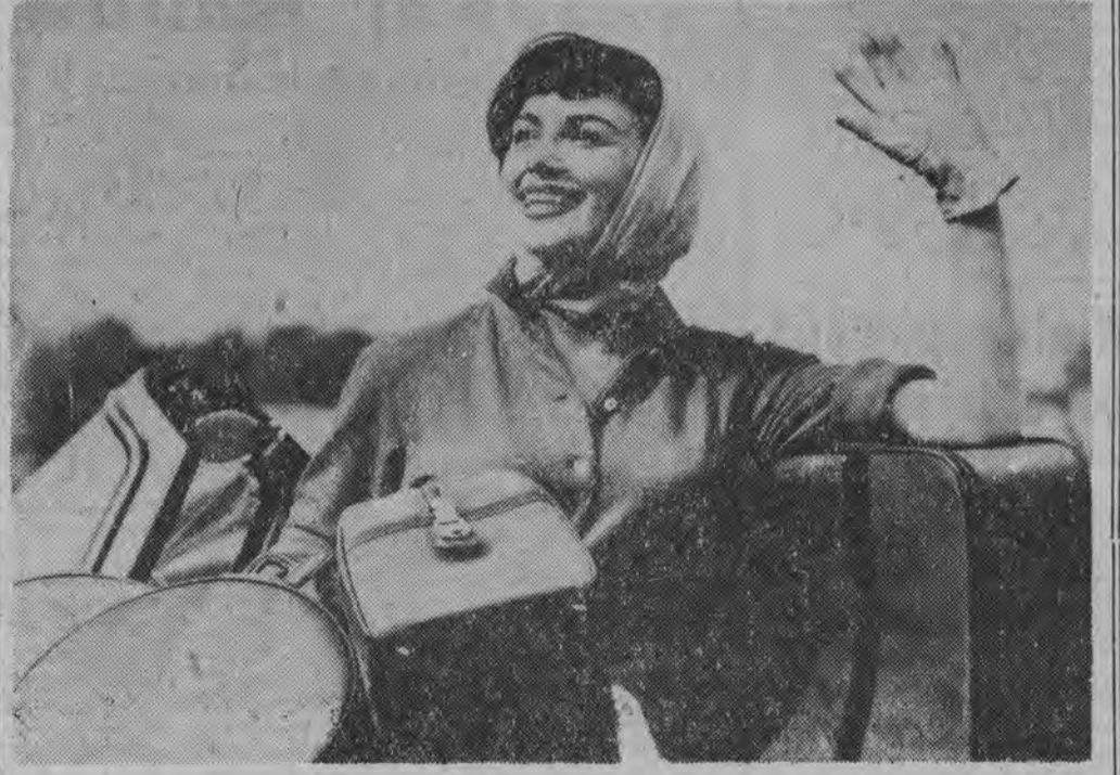
Żegnajcie, do zobaczenia na urlopie!