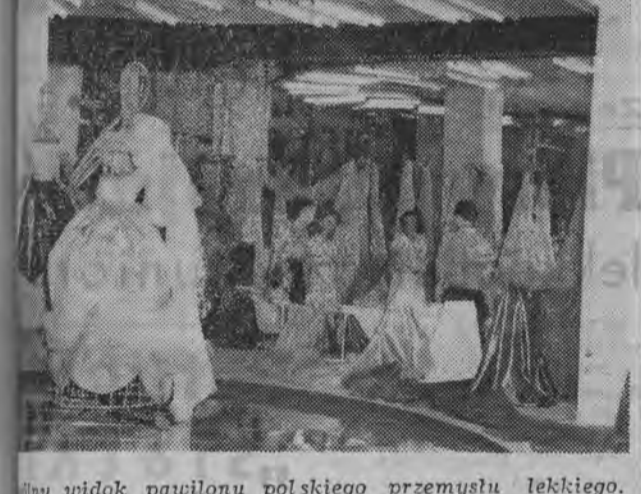
Widok pawilonu polskiego przemysłu lekkiego.