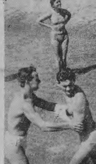
Najlepsze „lekarstwo” na upał... wodę...