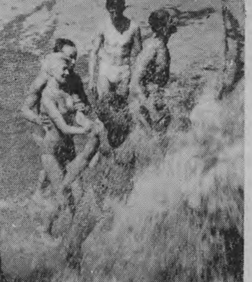
Najlepsze „lekarstwo” na upał... wodę...