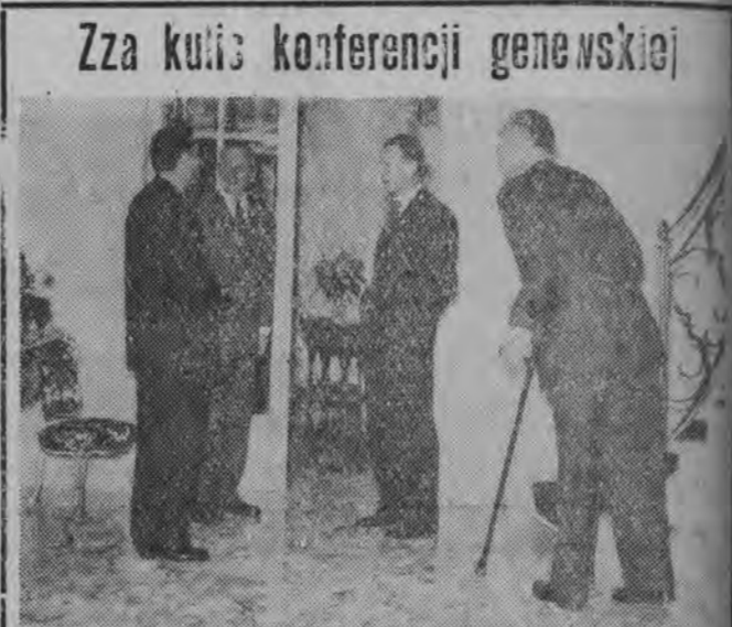
Za kulą konferencji genezyjskiej

W ub. niedzielę na stadionie w Łomży rozegrany został mecz piłkarski juniorów o klubowy Puchar Okręgu między miejscowymi ŁKS i Warmią Olsztyn. Zwyciężył ŁKS 2:1 (2:0).