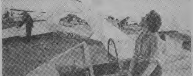
NA ZDJĘCIU: Pelagia Ma...

W ub. niedzielę na stadionie w Łomży rozegrany został mecz piłkarski juniorów o klubowy Puchar Okręgu między miejscowymi ŁKS i Warmią Olsztyn. Zwyciężył ŁKS 2:1 (2:0).