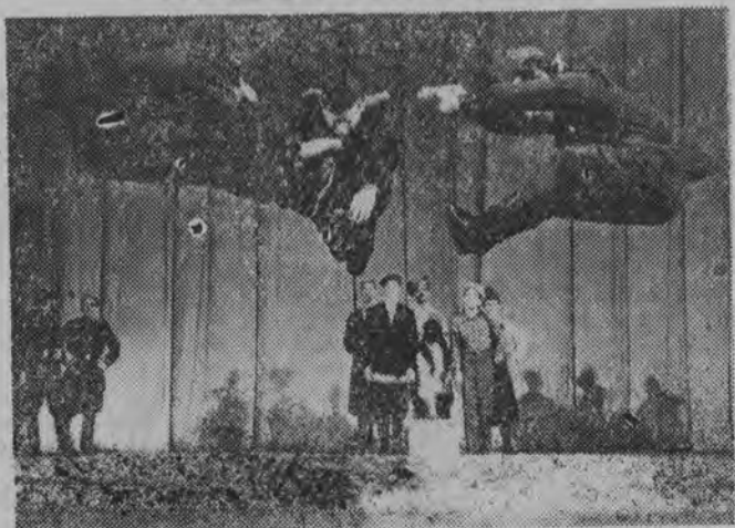
Efektowny fragment tańca rekrutów w wykonaniu zespołu Tańca Ludowego ZSRR.