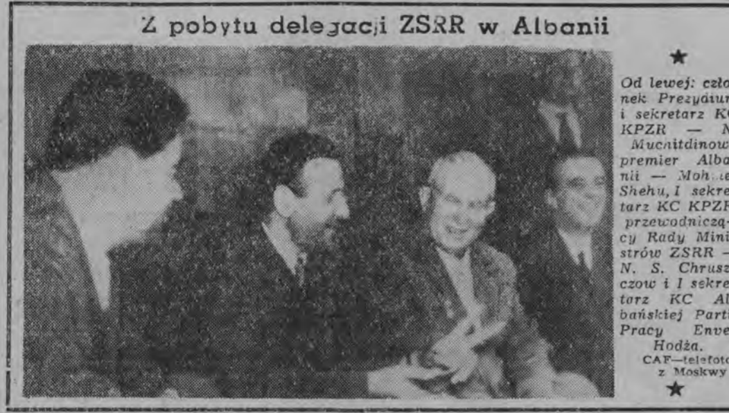
Z pobytu delegacji ZSRR w Albanii