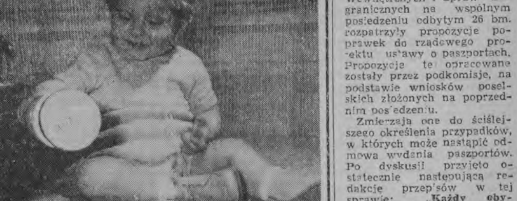
Przed Międzynarodowym Dniem Dziecka