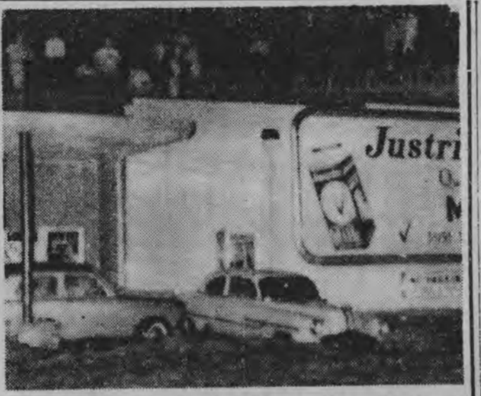
Gwałtowna burza spowodowała nasz powódź w St. Joseph...