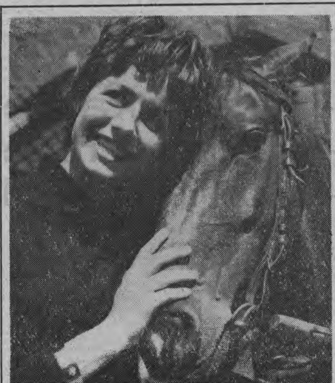
W MAJOWYM SŁONCU