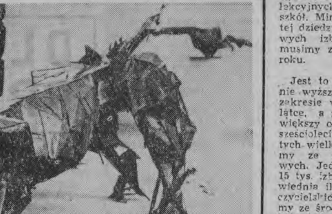
Sensacja wystawy sztuki nowoczesnej w Paryżu: jest rzeźba Auricoste p. „Potwór z Genewą”

Zapewne, ponad 4 tysiące izb przybędzie w tym roku szkolnictwu podstawowemu, ale to jest mniej niż połowa ilości nowoowartych oddziałów.