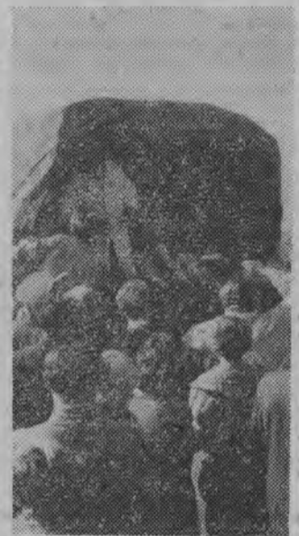
Bufet, jak widać, także miał powodzenie.

Największe zainteresowanie wzbudziły takie dyscypliny sportowe, jak szermierka, piłka ręczna (szczypiorniak) oraz biegi, a więc wszystkie