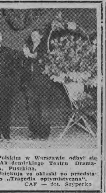
1 bm. w Państwowym Teatrze Polskim w Warszawie odbył się pierwszy występ Lenińskiego Akademickiego Teatru Dramatycznego im. A. Puszkina. NA ZDJĘCIU: aktorzy radzieccy dziękują za oklaski po przedstawieniu sztuki W. Wierszowskiego „Tragedia epimystyczna”.

Lekarze są bezradni. U łoża chorego czuwa bez przerwy rodzina — jego żona, dwóch synów, córka, brat i trzy siostry.