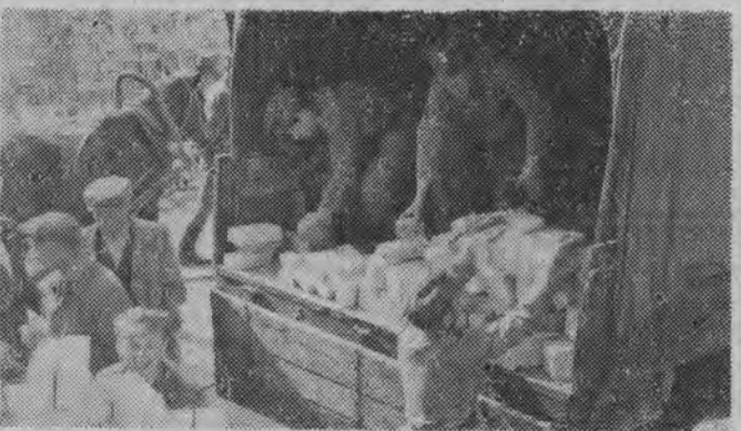
Przy transporcie cegły, z której niedługo już staną mury nowej szkoły, pomagają żołnierze KBW.