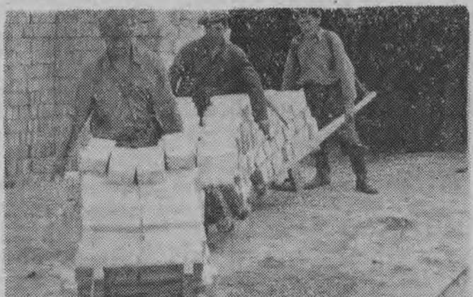
Załoga cegielni słowa dotrzymała. Oto pierwsza cegła z piecowego wypału.

Budowa szkoły w Złotorii absorbuje bez reszty mieszkańców wsi. Do pomocy przy budowie zgłaszają się wciąż nowi ludzie. Pracownicy cegielni znajdujący się w Złotorii postanowili dla uczczenia III Zjazdu PZPR wykonać w czynie społecznym i przekazać na budowę szkoły 30 tys. szt. cegieł.