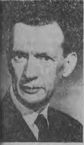
Minister spraw zagranicznych Francji — Couve de Murville.