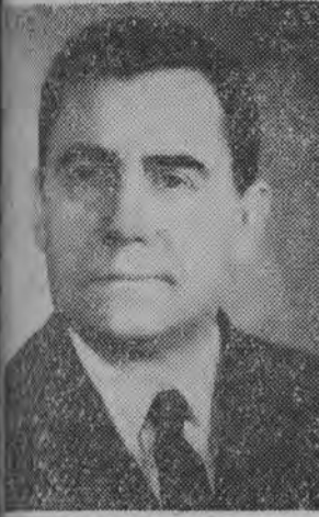
Minister spraw zagranicznych ZSRR — Andrzej Gromyko.

Spotkanie miało serdeczny i bezpośredni charakter. Władysław Gomułka interesował się wynikami pracy poszczególnych zakładów jak również osobistym życiem hutników.