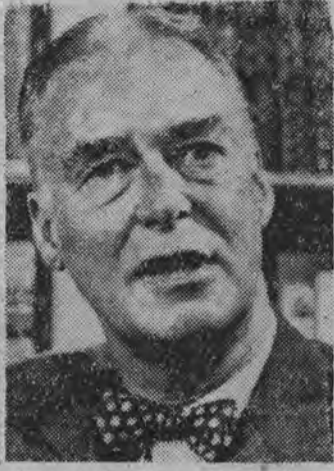
Sekretarz Stanu USA Christian Herter.