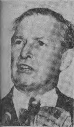
Minister spraw zagranicznych W. Brytanii — Selwyn Lloyd.