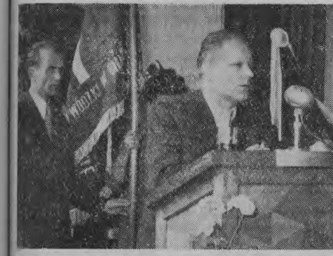
NA ZDJĘCIU: do młodzieży przemawia I sekretarz KW PZPR tow. Arkadiusz Laszewicz w chwili uroczystości nadania sztandaru Wzrostu i Rozwoju Ziem Zachodnich. W tle: Witold Mikulski przewodniczący ZW ZMW.