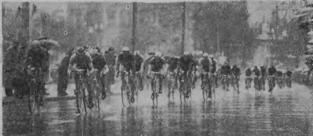
NA ZDJĘCIU: na ulicach Berlina.