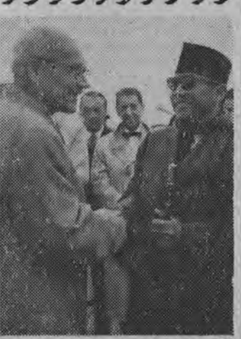
NA ZDJĘCIU: I sekretarz KC PZPR Władysław Gomułka z generałem prezydenta Indonezji dr Sukarno.

Marszałek Peng Teh-huai: Rozważanie problemu Niemiec i Berlina najpilniejszym zadaniem obecnych czasów