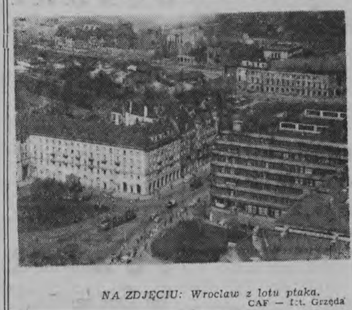
NA ZDJĘCIU: Wrocław z lotu ptaka.