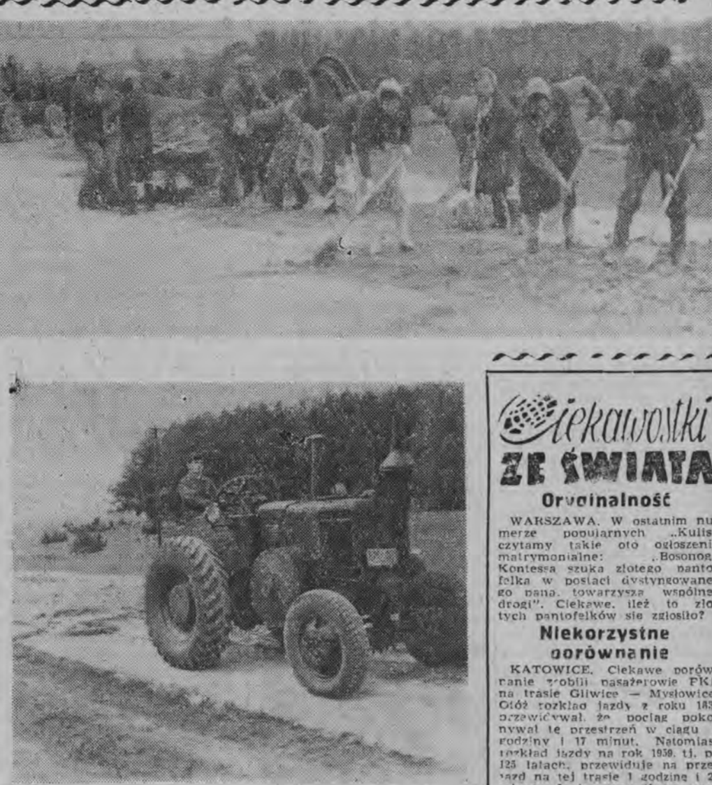
Traktor ciągnący za sobą specjalne sprzęty, wyrzynają najeździwiony zwiir i płasek. Wszędzie pracowano z zapalem.