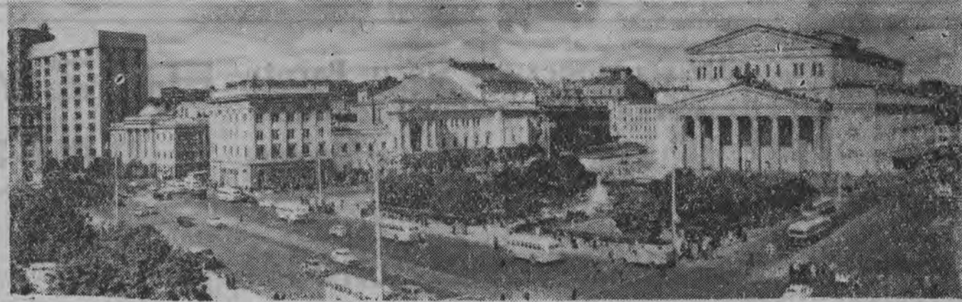
MOSKWA, PLAC SWIERDŁOWA

W wielu organizacjach partyjnych, zwłaszcza większych, nie wszyscy członkowie Ciąg dalszy na str. 4