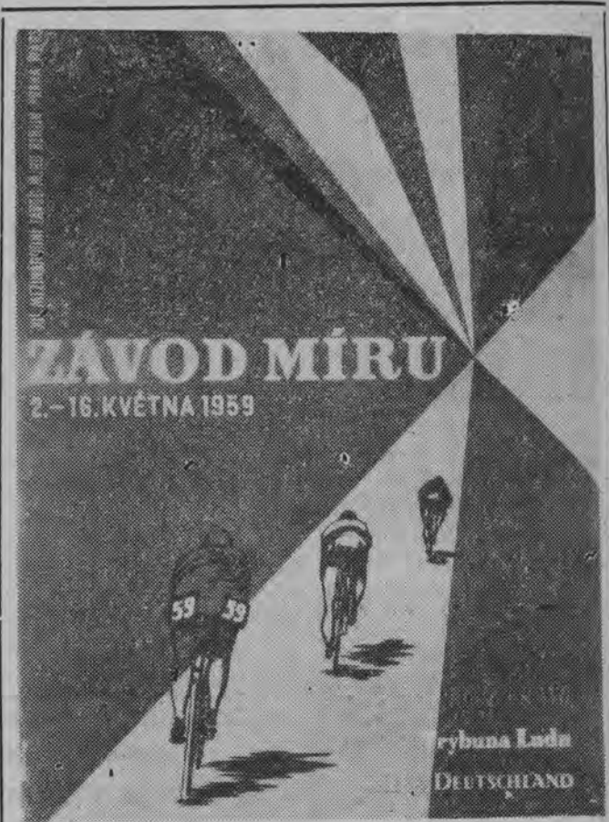
Piakt XII Wyścigu Pokoju wydany w CSR.

A oto zwycięzcy turnieju w kolejności wag od papierowej do ciężkiej: