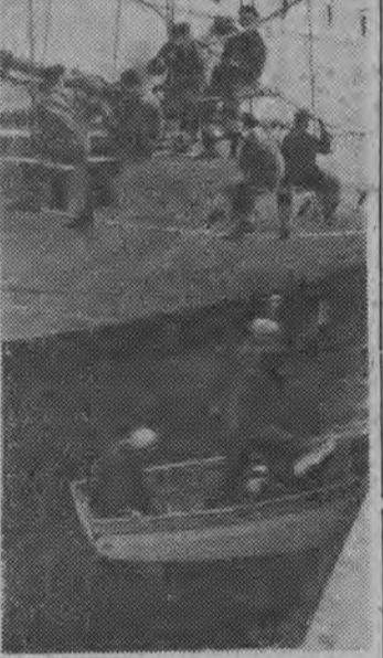
Już 15 kwietnia, tak jak co roku, szklany statek „Dar Pomorza” wyruszy w 3-miesięczny rejs na Morze Śródziemne.

GENEWA (PAP) 9. 4. Związek Radziecki zaproponował w środę utworzenie europejskiej organizacji handlowej i zwołanie konferencji ministrów handlu zagranicznego państw reprezentowanych w Europejskiej Komisji Gospodarczej ONZ (EKG).