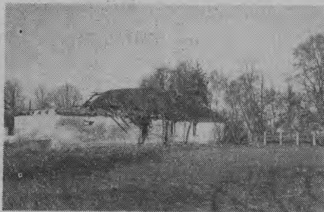
NA ZDJĘCIU: ruiny starej poczty przed adaptacją.

Z danych tych wynika, że około 23 proc. zakładów wodnych jest nie wykorzystanych. Pozostałe wykorzystują przeciętnie mniej niż 50 proc. energii średnich przepływów. Te cyfry są wymowne. Odkrywają poważną rezerwę naszej terenowej gospodarki. Rezerwę po którą należy i warto sięgnąć. (a)