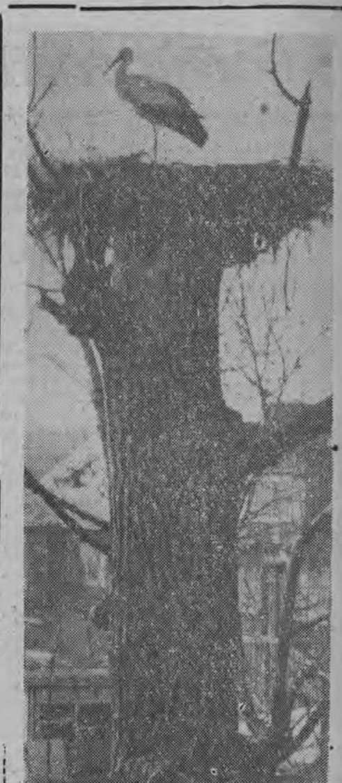
Bociek jest wierny. Od lat wraca wiosną w swoje strony.

Komitety blokowe w Bielsku-Podlaskim włączyły się do akcji zbiórki złomu na budowę szkół. W ciągu kilku dni zebrano 3.500 kg złomu, a uzyskane ze sprzedaży pieniądze w wysokości 1.670 zł przekazano na konto Powiatowego Komitetu Budowy Szkół w Bielsku-Podlaskim. NA ZDJĘCIU: złom zbiera blokowy ob. Aleksander Porejko.