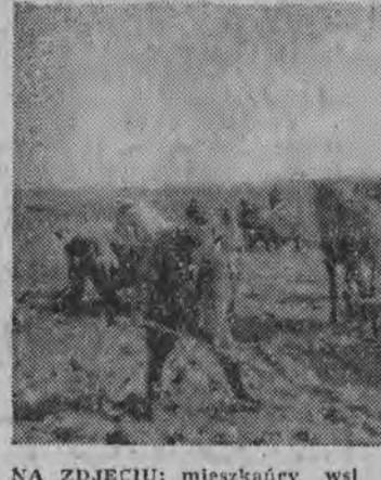
NA ZDJĘCIU: mieszkańcy wsi Milewo przy naprawie drogi.

BAGDAD (PAP) 23.3. Jak donosi agencja Reutersa, we wtorek przed sądem wojskowym w Bagdadzie rozpoczął się proces przeciwko 20 spiskowcom odpowiedzialnym za wywołanie rewolty w Mosulu.