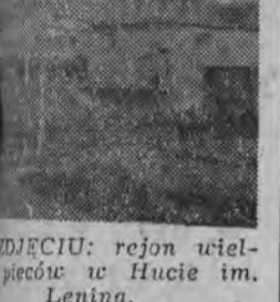
ZDJĘCIU: rejon wielopiętrowy w Hucie im. Lenina.