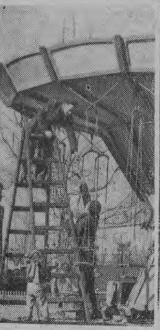
NA ZDJĘCIU: niebawem pójdzie w ruch karuzela — a tymczasem w miasteczku trwają wiosenne porządki...

Z Tunisu donoszą, że odbywają się tam, podobnie jak w innych miastach Tunezji, radosne obchody ludowe, poświęcone trzeciej rocznicy uzyskania niepodległości przez Tunezję. Zorganizowano m.in. w stolicy wielkie święto młodzieży tunezyjskiej, liczne koncerty, igrzyska sportowe i ognie sztuczne.