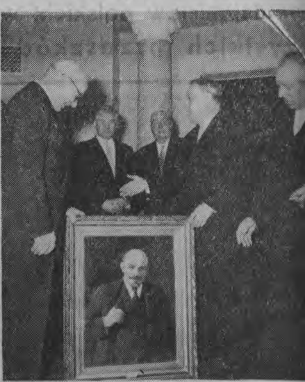
NA ZDJĘCIU: w imieniu delegacji KPZR N. G. Ignatow przekazuje w darze na ręce sekretarza KC PZPR Władysława Gomułki portret Lenina.