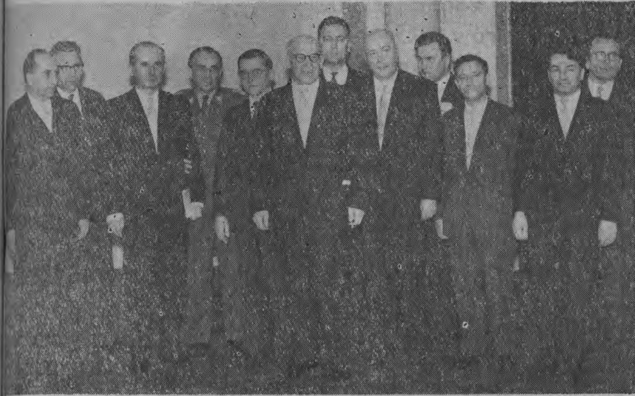
Biuro Polityczne Polskiej Zjednoczonej Partii Robotniczej.

(Z przemówienia tow. Gomułki wygłoszonego na III Zjeździe w dniu 19 bm.)