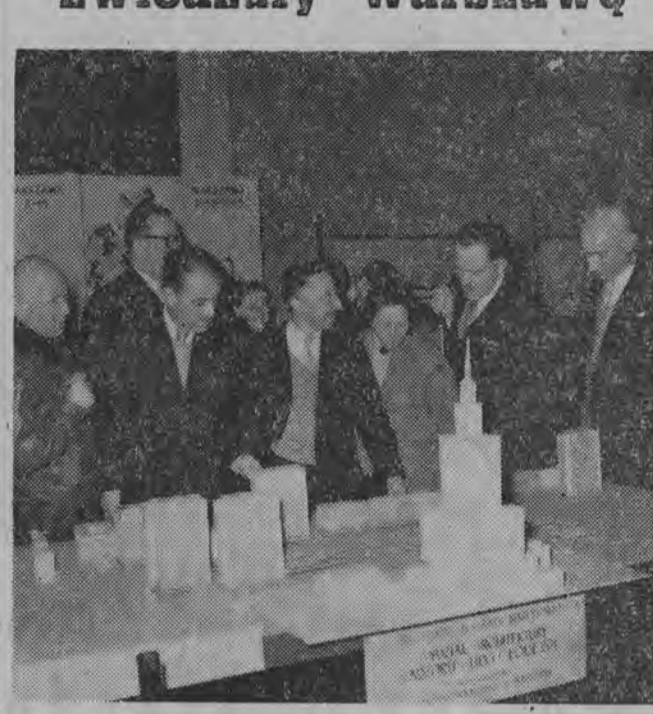
NA ZDJĘCIU: delegaci zwiedzają wystawę projektów zabudowy śródmieścia Warszawy.