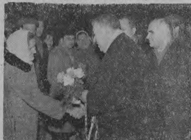
14 bm. członkowie delegacji KPZR na III Zjazd zwiedzili hutę „Warszawa”. W czasie zwiedzania huty odbył się wiec, na którym przemawiał przewodniczący delegacji N. G. Ignatow.

Opracowany został plan obchodów, zgodnie z którym w spółdzielniach tych odbędą się specjalne walne zebrania, na których spółdzielcy podsumowując 10-letnie doświadczenia omówią dalsze możliwości rozwoju swoich zespołowych gospodarstw. (lk)