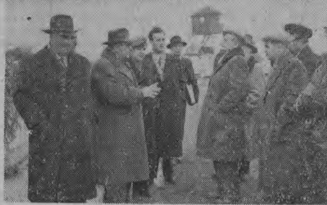
W dniu 15 marca 1959 r. delegacja Bułgarskiej Partii Komunistycznej na III Zjazd PZPR w towarzystwie ambasadora Bułgarii w Polsce odwiedziła województwo lubelskie zwiedzając między innymi Majdanek, Lublin, Kazimierz i Puławę.