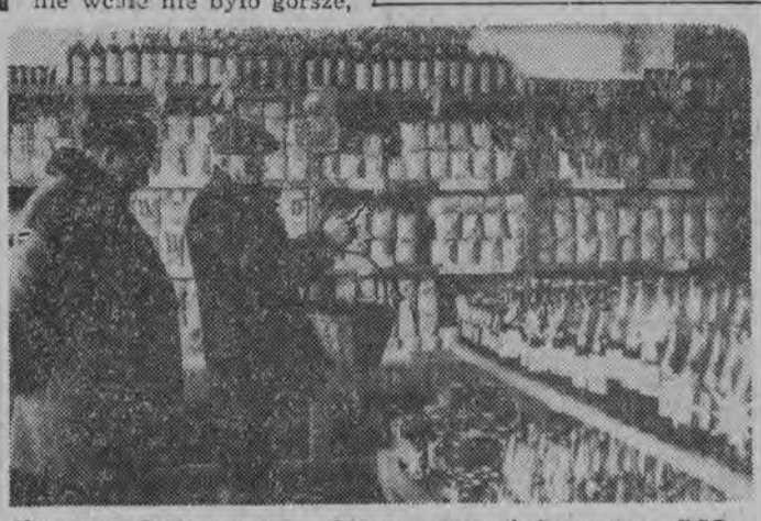
NA ZDJĘCIU: wnętrze sklepu samoobsługowego PSS w Siemiatyczach.

Poprzednio w lokalu tym były dwa sklepy: spożywczy i monopolowy, obydwa z pełną obsługą. Zaopatrzenie wcale nie było gorsze,