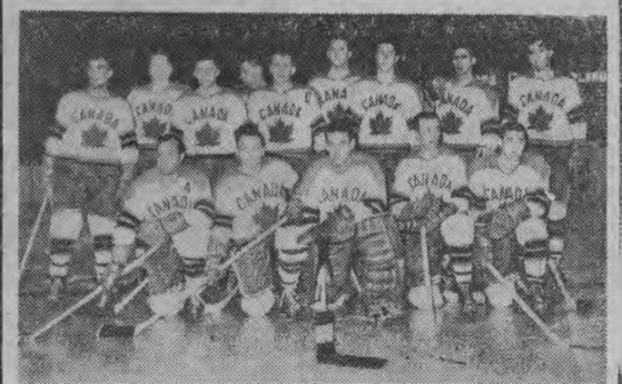
NA ZDJĘCIU: drużyna Kanady, która zdobyła w tym roku tytuł hokejowego mistrza świata.