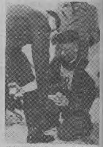
NA ZDJĘCIU: udzielenie pomocy sanitarnej.

seniorki — 1. LPZ Łomża — 376 pkt. (Kawczyńska, Sokolowiczka, Kojro), 2. LPZ Bielsk-Podlaski — 362 pkt.; seniorzy — 1. zespół Grajewo — 354 pkt., 2. LPZ Łomża — 337 pkt.