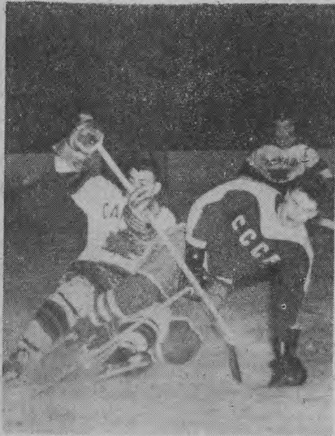
NA ZDJĘCIU: fragment finałowego meczu Kanada — Związek Radziecki 3:1.

W niedzielę, w ostatnim dniu finałowego turnieju hokejowych mistrzostw świata w Pradze doszło do niespodzianki dużego kalibru. Oto zdecydowani faworyci, hokeiści Kanady po bardzo zaciekłej walce przegrali z Czechosłowacją 3:5 (0:2, 1:1, 2:2). W meczu tym burzliwie dopiniani przez widzów Czesi, wzniesli się na wyżyny hokeja, walczyli z rzadko spotykaną bojowością i ambicją. Gra była momentami bardzo ostra, a Kanadyjczycy grali dość często w czwórkę i nawet w trójkę.