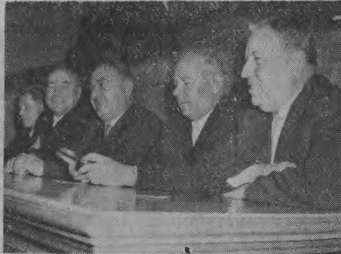
Na sali obrad delegacja ZSRR.

Po przerwie obiadowej przewodniczący obrad obejmując sekretarz KC PZPR Je-