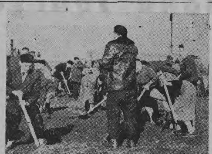
NA ZDJĘCIU: mieszkańcy Mońki w czynnie zjazdowym zasypują ziemię i zwierzem obu stronach ulicy Białostockiej.

Pogoda naprawdę wiosenna. W godzinach popołudniowych prawie na wszystkich ulicach widać ożywiony ruch.