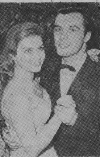
NA ZDJĘCIU: król nart Toni Sailer i piękna aktorka filmowa Margit Nunnks.

(Inf. wł.) W kolejnych meczach, rozegranych w Warszawie o mistrzostwo III ligi dwa nasze zespoły — Ognisko Białystok i AZS odniosły dalsze sukcesy wygrywając wszystkie spotkania: Ognisko — Drukarz Warszawa 3:2 (12:15, 15:8, 15:17, 8:15, 15:12). AZS Białystok — Starówka II 3:0 (15:12, 15:6, 15:4). Ognisko — Starówka II 3:1 (12:15, 15:11, 15:10, 15:7). AZS Białystok — Drukarz Warszawa 3:2 (15:13, 17:15, 8:15, 10:15, 16:14). (t)