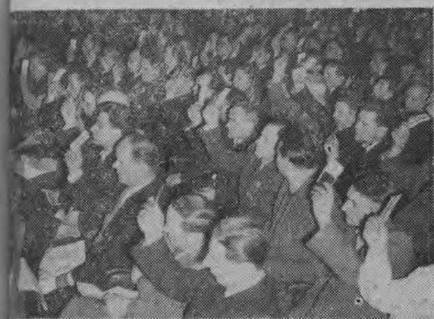
14 bm. obradowała w Katowicach — pierwsza w kraju — wojewódzka konferencja PZPR, poświęcona ocenie dotychczasowej przedzjazdowej na terenie województwa oraz wyborom delegatów na III Zjazd partii. NA ZDJĘCIU: widok ogólny sali obrad w czasie głosowania.