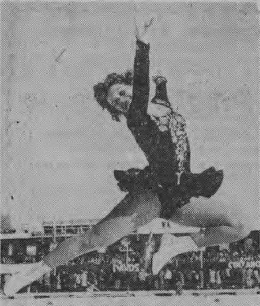
NA ZDJĘCIU: Hanna Walter (Austria) — mistrzyni Europy w jeździe figurowej na lodzie.