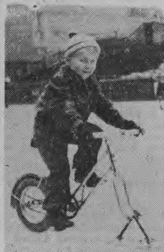
Rover — byłoby to nowa atrakcyjna rozrywka sportowa austriackich dzieci. NA ZDJĘCIU: mały wiecdeńczyk demonstruje jazdę na tym sprzęcie.