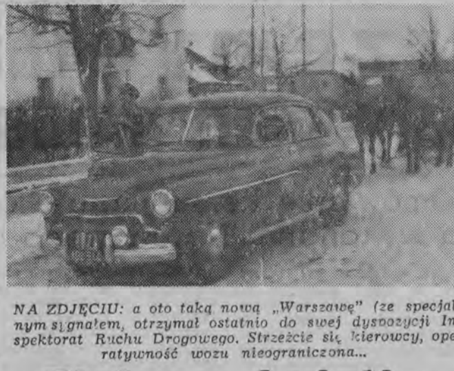
NA ZDJĘCIU: a oto taka nowa „Warszawa” (ze specjalnym sygnałem, otrzymał ostatnio do siebie dystrybucji Inspektorat Ruchu Drogowego. Strzeżcie się, kierowcy, operatywność użyciu nieograniczona...