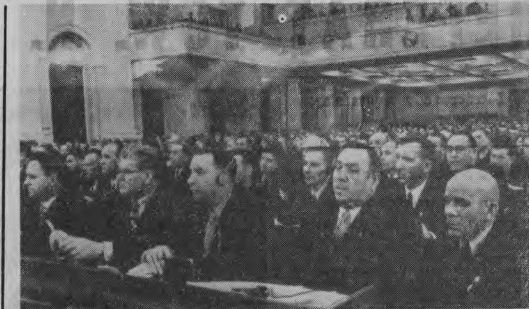
Otwarcie XXI Zjazdu KPZR. NA ZDJĘCIU: w Wielkim Pałacu Kremlońskim w cza- sie obrad.

Jugosławia Środowa prasa jugosłowia- ńska publikuje obszernie wyjątki z referatu Chruszczo- wczarza ogłoszonego w dniu wczorajszym na pierwszym posiedzeniu XXI Zjazdu KPZR.