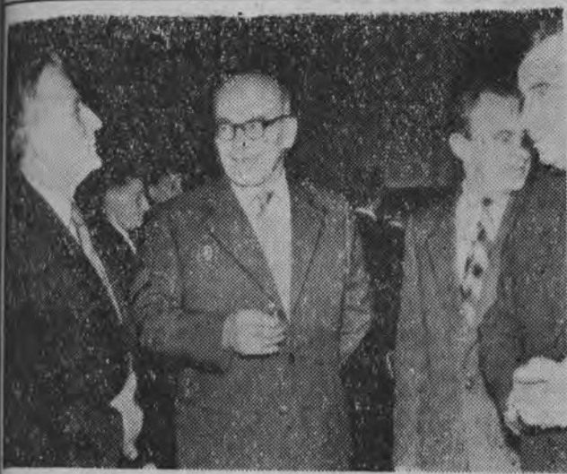
Przewodniczący delegacji CSR A. Novotny (z lewej) oraz przewodniczący delegacji PRL Władysław Gomułka w czasie obrad XXI Zjazdu KPZR w Wielkim Pałacu Kremlońskim w Moskwie.