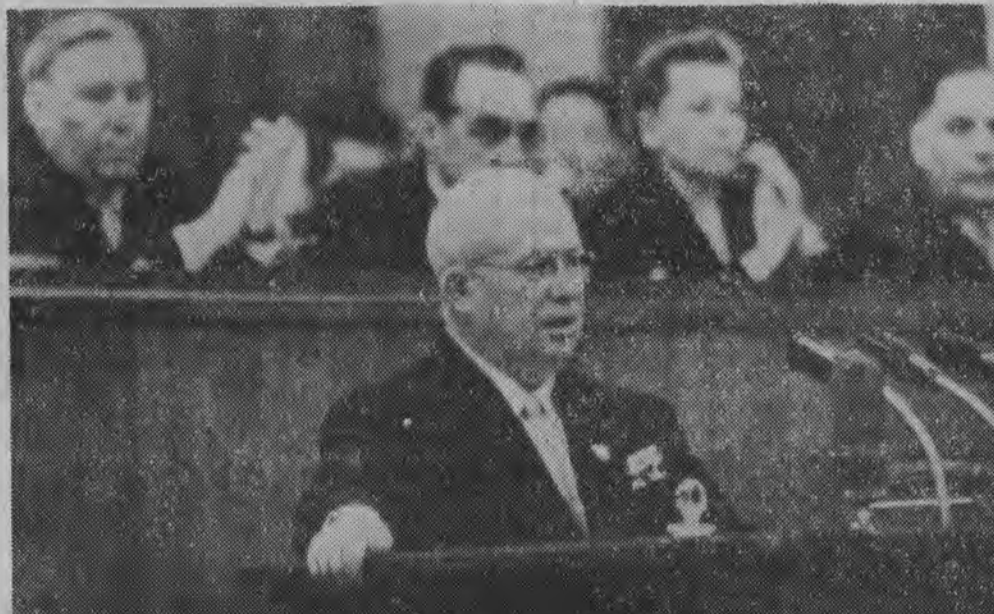
I sekretarz KC KPZR N. S. Chruszczow przemawia na otwarciu XXI Zjazdu KPZR 27 stycznia 1959 r.

— Ponieważ w Zjednoczonej Republice Arabskiej miały niedawno miejsce wystąpienia przeciwko ideom komunizmu i wysunięto tam oskarżenia pod adresem komunistów, ja jako komunista uważam za konieczne oświadczyć na Zjeździe naszej partii komunistycznej, że jest rzeczą niesłuszną oskarżać komunistów o to, że przyczyniali się do osłabiania lub rozpraszania wysiłków narodowych w walce przeciwko imperializmowi. Wreć przeciwnie, nie ma ludzi bardziej niezłomnych i oddanych sprawie walki przeciwko kolonizatorom jak komuniści.