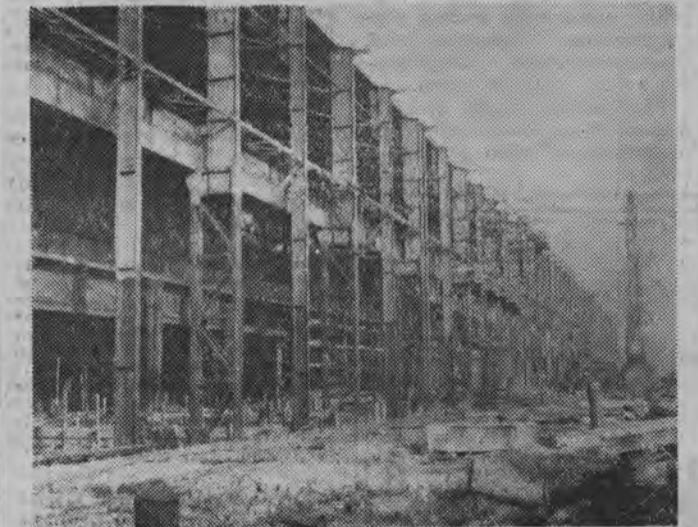
W hucie im. Lenina trwają prace przy rozbudowie kombinatu, obejmujące m. in. koksownię i nowe zakłady walcownicze. NA ZDJĘCIU, fragment budowy hali walcowni rylki.