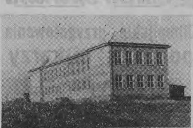
Piękny gmach nowej szkoły w Bogdanekach (pow. białostocki).

Może trochę przesada, bo widoczne na zdjęciu dwie zausze budynku szkoły to nie grzyb i potrzebuje więcej czasu, żeby „urosnąć”, ale nie ma miesiąca, żeby wsiach naszego województwa nie oddawano do użytku nowych, ładnych