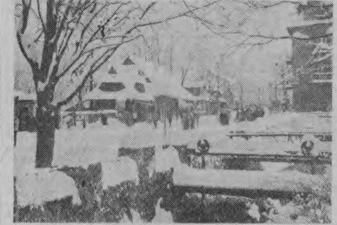
NA ZDJĘCIU: na Krupówkach.

W ub. sobotę odbyło się w Białymstoku plenum Wojewódzkiego Komitetu Frontu Jedności Narodu. Było ono poświęcone zagadnieniom związanym z realizacją wysołowanego przez partię hasła „Tysiąc szkół na Tysiąclecie Państwa Polskiego”.