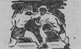
go przeciwnika i obsypywał go gradem ciosów, stosując przy tym piękne uniki. Sędziowie przyznali wysokie zwycięstwo Piotrowiczowi (60:54, 60:55, 60:54).