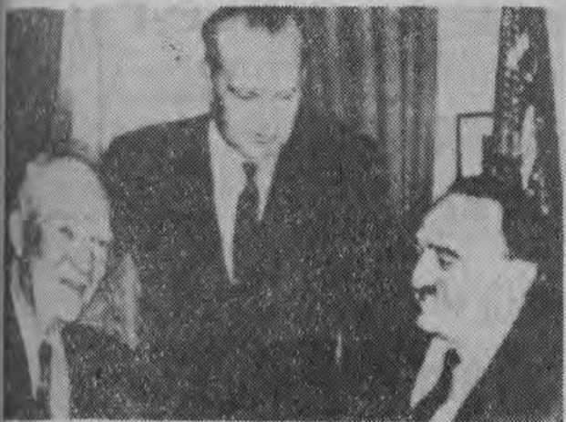
Prezydent Eisenhower (z lewej) rozmawia z wicepremierem Mikojanem w Białym Domu, 17. I. 1959 r. W środku — ambasador radziecki w USA Mienszиков.