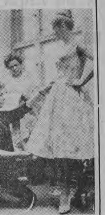
Domu Mody w NRD już obecnie opracowują modele wiosenne i letnie na sezon 1959 r.

WARSZAWA (PAP) 15.1. 15 bm. odbyło się w Warszawie plenium Zarządu Głównego Towarzystwa Przyjaciół Polako-Radzieckiej. Głównym tematem obrad był ustalenie planu działalności Towarzystwa na rok bieżący.