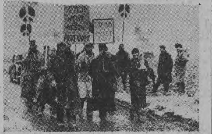
Tłum demonstrantów wtargnął na teren bazy raketowej North Pickenham w hrabstwie Norfolk domagając się zaprzestania instalacji wyrzutni raketowych. NA ZDJĘCIU: uczestnicy demonstracji opuszczają bazę.