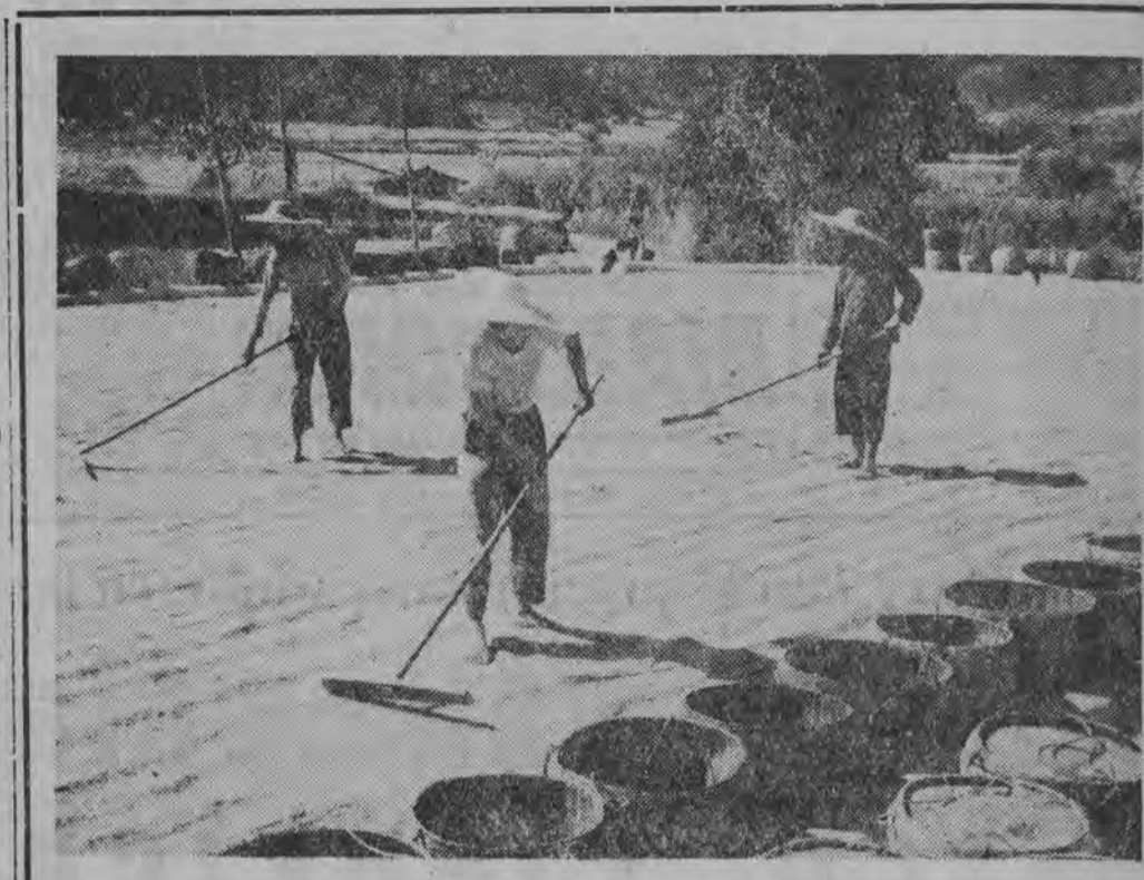
U nas zaczęła się już zima, a w Chinach trwają jeszcze zbiory późnego ryżu.

Ubezpieczenia rolne stanowiące niezbędny element rozwoju gospodarczego wsi - to temat żywo interesujący rolników. W związku z tym zwróciliśmy się do kierownika biuletynu wojewódzkiej PZU w Bielsku Podlaskim ob. Jerzego Olszńskiego o udzielenie kilku odpowiedzi na pytania interesujące naszych Czytelników.