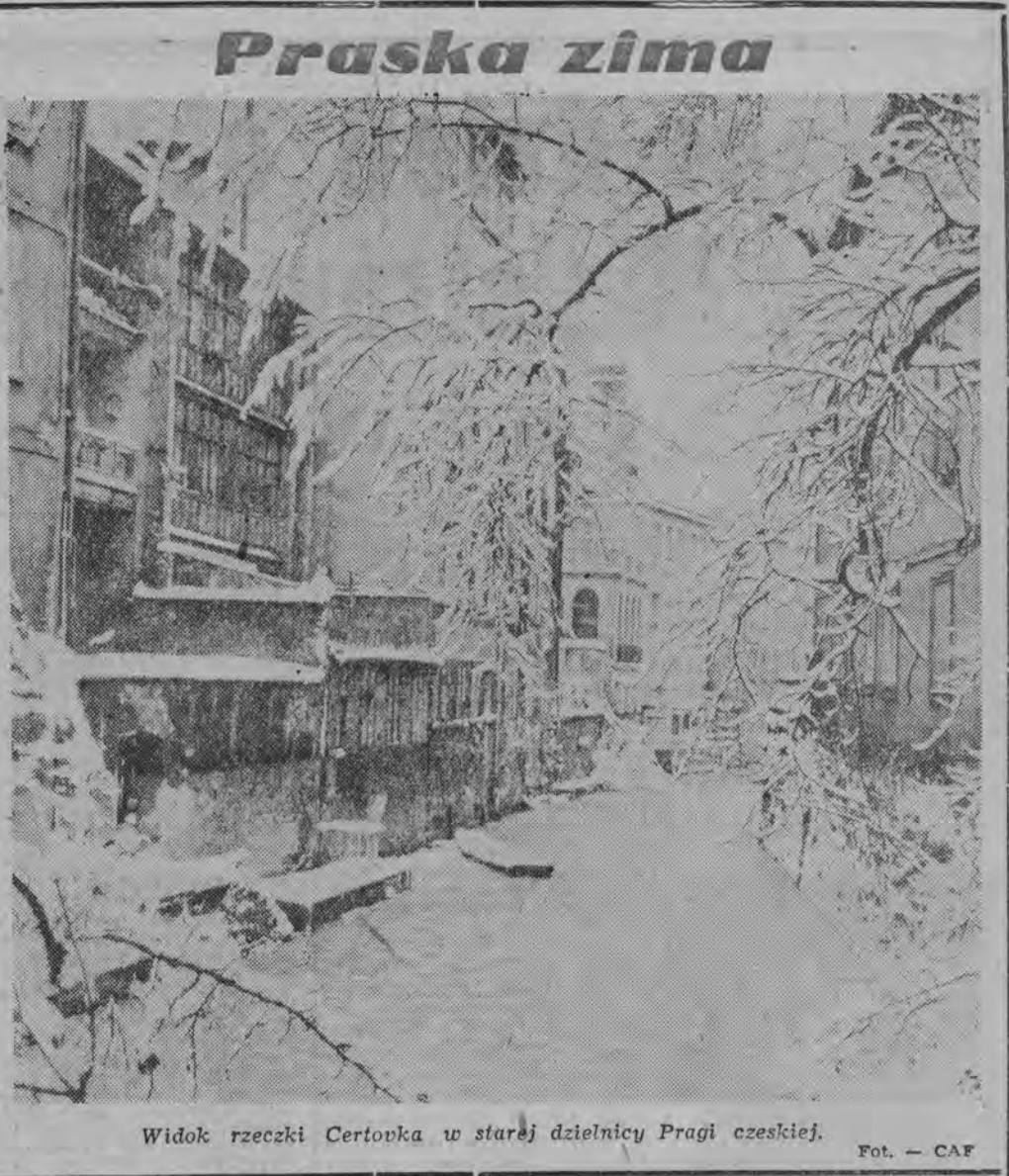
Widok rzeczki Certovka w starej dzielnicy Pragi czeskiej.