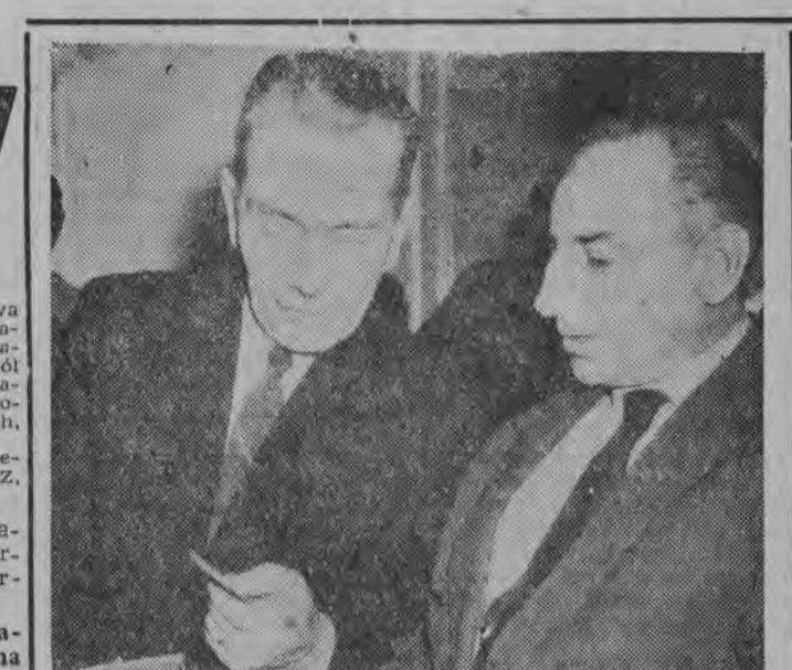
W dniu 11 grudnia w Warszawie odbył się czwarty plenarystyczny posiedzenie Zarządu Głównego Ligi Przyjaciół Zolmerza. W obradach plany, które poświęcone były pracy w kierunku społecznej, kulturalnej i gospodarczej, TRZZ w pełni włącza się do zadań postawionych przez XII Plenum KC PZPR i bierze aktywne udział w ich realizacji. Śladem z tego jest szczególnie troską dojmującym hasło „Tysiąc szkół na Tysiąclecie”. Wielką naszą troską jest aktywizacja małych miasteczek i osiedli, Lit. czymy na ożywienie ruchu kulturalnego i wczesnego. Sprawy akcji osiedleńczej, wzrostu produkcji rolnej, pełniejszego rozwoju rzemiosła i drobnej wytwórczości, budownictwa i produkcji materiałów budowlanych - są to wszystkie zadania, do realizacji których pracownicy przyznają się z wielką determinacją i wykreślać rezerwy i braki uchodzące uwadze rad narodowych.

Przez wszystkich bardzo ładnie rozwija się inicjatywa czynna społeczna. Na przykład w powiecie Goldap nasz aktyw wspólnie z działaczami tamtego powiatu przystąpił do budowy przystanku wodnej, która ma stać się dla tego miasta ośrodkiem kulturalnym i sportowym. Wartość tego czynu oblicza się na 250 tysięcy zł. W Oleku podjęto społeczną budowę powiatowego domu kultury. Ze składek społecznych zebrano na ten cel 115 tysięcy złotych.