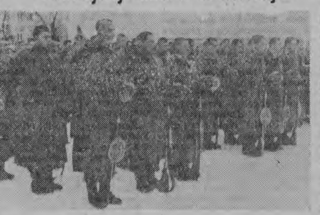
Młodzi żołnierze w skupieniu powtarzają słowa przysięgi za dowódcą jednostki.