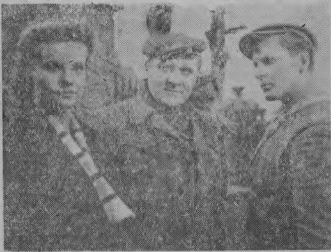
Dzisiaj zamieszczamy fotos nr 8. A oto pytania konkursowe: