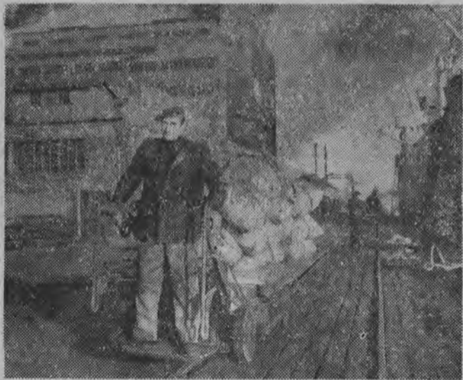
Statek „Małgorzata Fornalska”, który ostatnio wplywał do portu gdyńskiego, przywiózł między innymi przeszło 125 ton ryżu przeznaczonych przez społeczeństwo Wietnamskiej Republiki Demokratycznej dla ofiar powodzi w naszym kraju. Rozdzielał ryż za namienia Polski Czerwony Krzyż. NA ZDJĘCIU: transport worków z ryżem do magazynu.