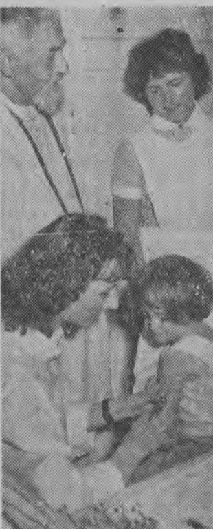
Rozpoczęła się II seria szczepień przeciwko Heine-Medina. Dzieci, jak widać na zdjęciu przyjmują zabieg jako jeszcze jedną atrakcję.