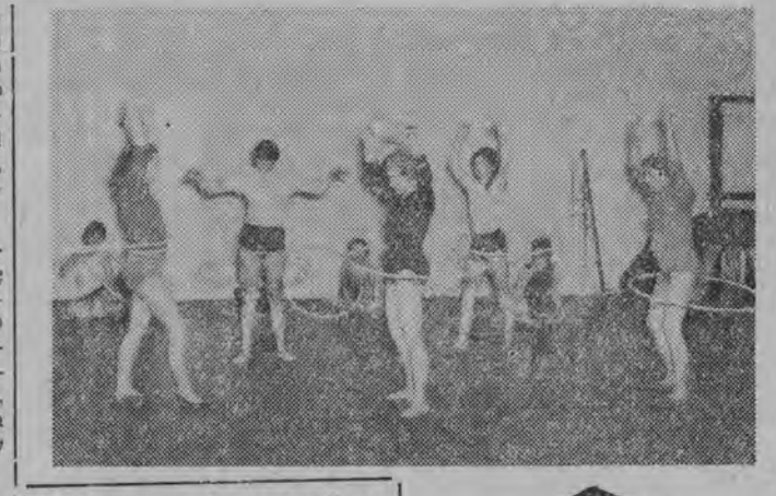
Młode entuzjastki gimnastyki akrobatycznej. NA ZDJĘCIU: na zacięciach sekcji gimnastyki akrobatycznej warszawskiej Polonii. Dziewczeta wykonują tancerz z obręczami.

AZS uległ Warmii Olsztyn 56:62 (19:25) oraz Orłowi Ketrzyn 35:76 (18:36), a Wióknierz przegrał z Warmią 49:91 (26:40) i Orłem 29:117 (9:49).