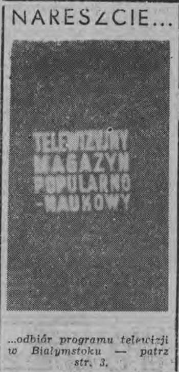
...odbior programu telewizyjnego w Białymstoku — patrz str. 3.