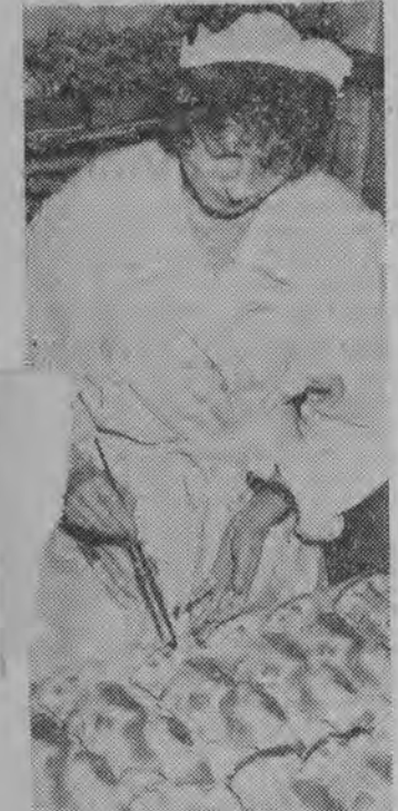
Artystyczna wytwórnia wyrobów z cukru i czekolady „Elandia” w Poznaniu...