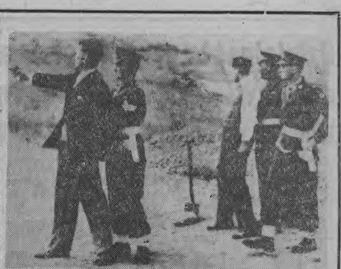
W ostatnim okresie nawet cywilni obywatele angielscy zostali zaopatrzeni w broń.

Przechodząc do spraw rolnictwa musimy stwierdzić, że pomimo wyraźnego ożywienia, wyniki produkcji rolnej nie osiągnęły naszych przewidywań. Plony zbóż nie wzrosły w przewidywanym rozmiarze; zakładaliśmy