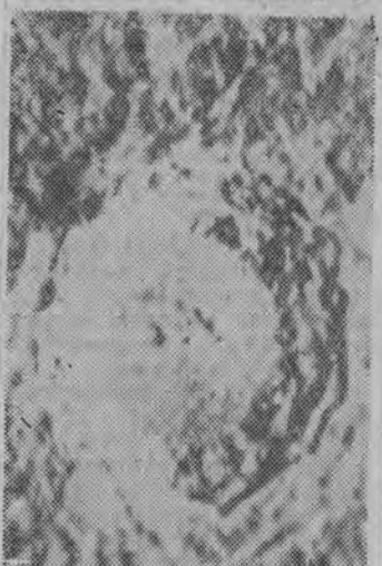
NA ZDJĘCIU: jeden z kwaterów (lub kotłowni) na Księżycu.

WASZYNGTON (PAP) 16. 11. Departament Stanu USA opublikował oświadczenie w związku z projektem porozumienia zgłoszonego przez ZSRR na genewskiej konferencji, a dotyczącego zaprzestania doświadczeń z bronią atomową i wodorową. Oświadczenie stwierdza, że projekt radziecki „jest nie do przyjęcia dla Stanów Zjednoczonych”.