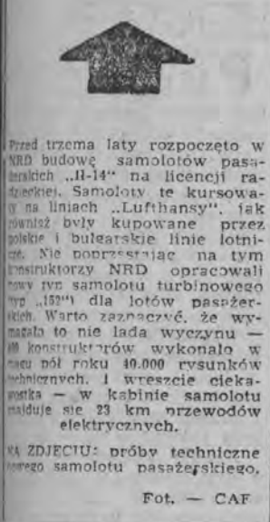
NA ZDJĘCIU: próby techniczne nowego samolotu pasażerskiego.

DELHI (PAP) 16. 11. W jednej z dzielnic stolicy Pakistanu, Karaczi, wybuchła epidemia cholery. W ciągu dwóch dni zmarła 12 osób. Dzielnica została otoczona kordonem sanitarnym i nikt z mieszkańców nie ma prawa opuścić jej granic. Zarządzono szczepienia ochronne na szeroką skalę.