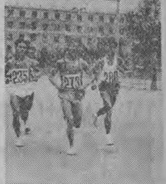
Chińscy lekkoatleci — długodystansowcy biją rekord olimpijski w biegu maratońskim w Pekinie. NA ZDJĘCIU: zawodnicy na trasie maratonu. Zwycięzcą Cheng Chao-hsin (nr 235).

Z okazji jubileuszu składamy i my działaczom, trenerom oraz sportowcom Gwardii serdeczne gratulacje. (ko)