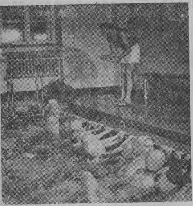
We wszystkich szkołach podstawowych wprowadzone zostało w ramach godzin wychowania fizycznego obowiązkowe nauczanie pływania. Nauka pływania trwa 4 tygodnie. W związku z tą akcją wszystkie kryte pływalnie udostępnione zostały młodzieży szkolnej. NA ZDJĘCIU: młodzież szkolna klasy V ze Szkoły Podstawowej nr 186 w Warszawie podczas nauki pływania na basenie St. KKF w Warszawie. A w Białymstoku?

W spotkaniach objętych zakładowym P.P. Totalizator Sportowy padły następujące wyniki: Arsenal — Nottingham Forest 3:1, Birmingham City — Newcastle 1:0, Bolton Wanderers — Manchester United 3:1, Burnley — Wolverhampton Wanderers 0:2, Everton — West Ham United 2:2, Leeds United — Blackpool 1:1, Leicester City — Aston Villa 6:3, Luton Town — Tottenham Hotspur 1:2, Manchester City — Chelsea 5:1, Preston North End — Portsmouth 3:1, West Bromwich Albion — Blackburn Rovers 2:3, Sunderland — Barnsley 2:2, Swansea — Sheffield United 0:2.