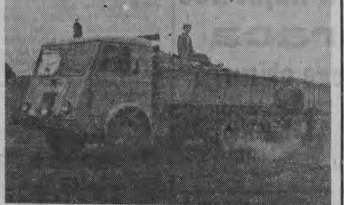
NA ZDJĘCIU: samochody PKS z Siatycz kursują bez przerw.

Jak co roku najczęściej kłopot w czasie przewozów sprawiają buraki cukrowe i ziemniaki. Jest ich bowiem w porównaniu z innymi ziemniolodami najwięcej.