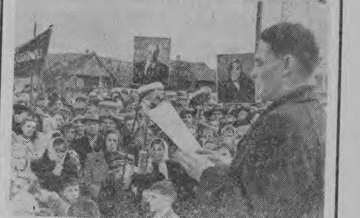
Uczestnicy mityngu słuchają tekstu rezolucji.

Jak już pisaliśmy, w ubiegłą niedzielę odbył się w Kuźnicy wielki wiec na rzecz pokoju. Wzięli w nim udział robotnicy oraz przedstawiciele związków zawodowych BSRR i Białostocznicy. Po spotkaniu obu grup, które nastąpiło na granicy polsko-radzieckiej, manifestanci udali się na miejsce mityngu do Kuźnicy. Po