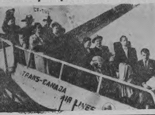
Wycieczka 18 radzieckich inżynierów - elektryków przybyła do Toronto (Kanada) w celu zwiedzenia wielkiej hydroelektrowni na jeziorze Ontario.