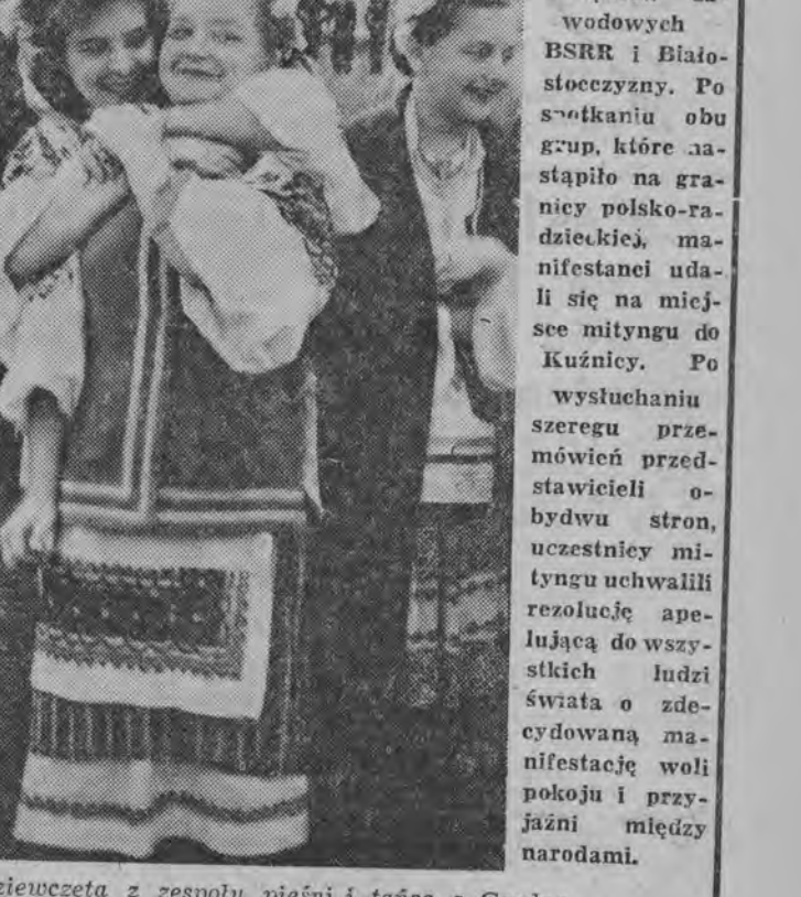
Dziewczeta z zespołu pieśni i tańca z Grodna.

Jak już pisaliśmy, w ubiegłą niedzielę odbył się w Kuźnicy wielki wiec na rzecz pokoju. Wzięli w nim udział robotnicy oraz przedstawiciele związków zawodowych BSRR i Białostocznicy. Po spotkaniu obu grup, które nastąpiło na granicy polsko-radzieckiej, manifestanci udali się na miejsce mityngu do Kuźnicy. Po