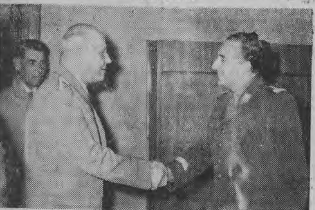
10. X. 58 r. przybyła do Warszawy na uroczystości związane z obchodem XV-lecia Ludowego Wojska Polskiego delegacja armii radzieckiej z marszałkiem Związku Radzieckiego I. Koniewem na czele. NA ZDJĘCIU: marszałek Związku Radzieckiego I. Koniew u ministra Obrony Narodowej generała broni Mariana Spychalskiego.