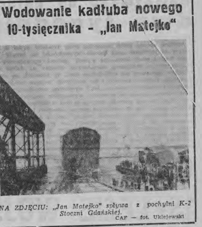
Wodowanie kadłuba nowego 10-tysięcznika - „Jan Matejko” NA ZDJĘCIU: „Jan Matejko” służyła z pochylm K-2 Stocznia Gdańskie.

Wielkie, ale nie mówili Kontrola PIH w łomżyńskiej Powzechnej Spółdzielni Spożywców trwa nadal. Codziennie wychodzą na światło dzienne różne „cudna” i „cudaki”. W miarę otrzymywania w tej sprawie materiałów będziemy informować Czytelników na łamach „Gazety”.