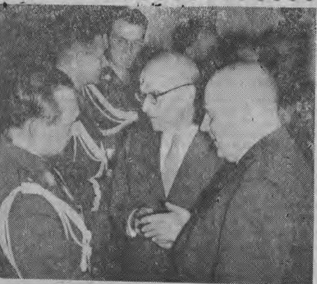
11. X. 1958 r. z okazji XV rocznicy Wojska Polskiego Przewodniczący Rady Państwa Aleksander Zawadzki dokonał nominacji i wręczył wysokie odznaczenia państwowe generałom i wyższym oficerom Wojska Polskiego.