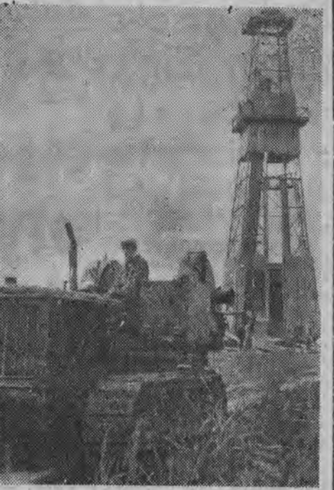
W rejonie Mielca, po 3 miesiącach intensywnych wierceń wykryto ropę naftową. Wiercenia zlokalizował doc. Obuchowicz z Krakowskiej Akademii Górniczo-Hutniczej. Szyb wiercono pod kierunkiem inż. Biernackiego. Jest to pierwsze odkrycie ropy w Polsce poza rejonem Podkarpacia. NA ZDJĘCIU: fragment szybu.