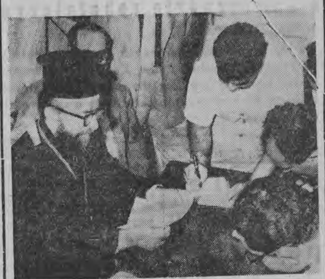
Biskup Anthimos odczytuje na konferencji prasowej w Nikozji odezwę arcybiskupa Makariosa...