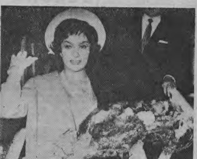
Gina Lolobrigida, która grać ma rolę królowej Saby w filmie pt. „Salomon i Saba” (wraz z Tyrone Pover i George Sanders), przybyła do Madrytu.