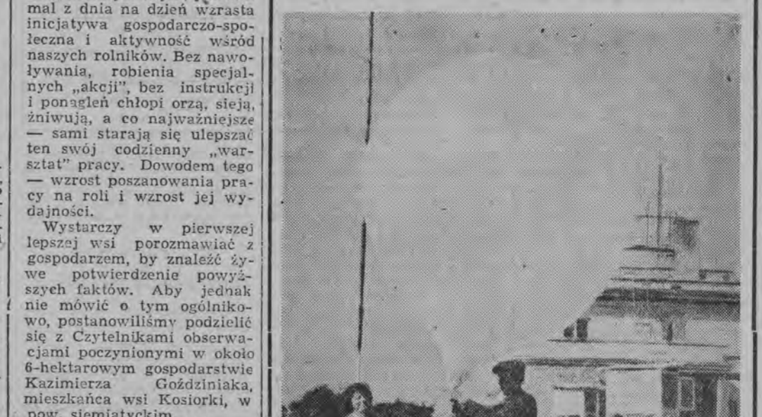
Zakład Aerologii w Legionowie koło Warszawy jest jedną z licznych placówek Państwowego Instytutu Hydro-Meteorologicznego, rozsypanych na terenie całego kraju.