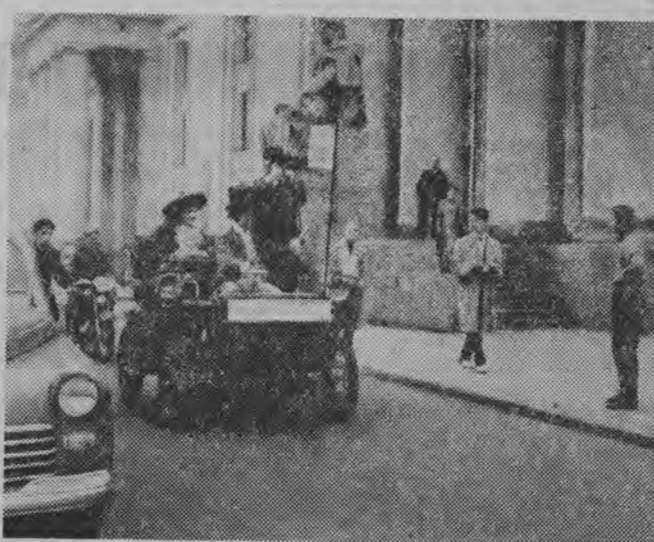
Z okazji „Tygodnia Ochrony Zabytków Techniki“ zorganizowano w Pałacu Kultury w Warszawie pokaz samochodu starego typu. NA ZDJĘCIU: samochód marki „Daimler“ z roku 1899 wraz z „pasażerami z tej epoki“ w czasie jazdy koło Pałacu Kultury.