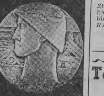
Medal pamiątkowy na 15-lecie Wojska Polskiego.

W ramach obchodów 15 rocznicy powstania Ludowego Wojska Polskiego w piątek, 3 bm., obok ratusza koncertowała orkiestra KBW, a w sobotę jeździł po mieście wóz radiowy LPZ nadający pogadanki o okolicznościach i muzykę z płyt. W godzinach wieczornych ekipa tego wozu wyświetliła na murach ratusza film produkcji polskiej pt. „Godziny nadziei”. (sg)