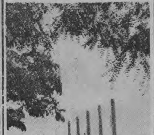
NA ZDJĘCIU: widok stalowmi i walcowni tu Brandenburgu (NRD).