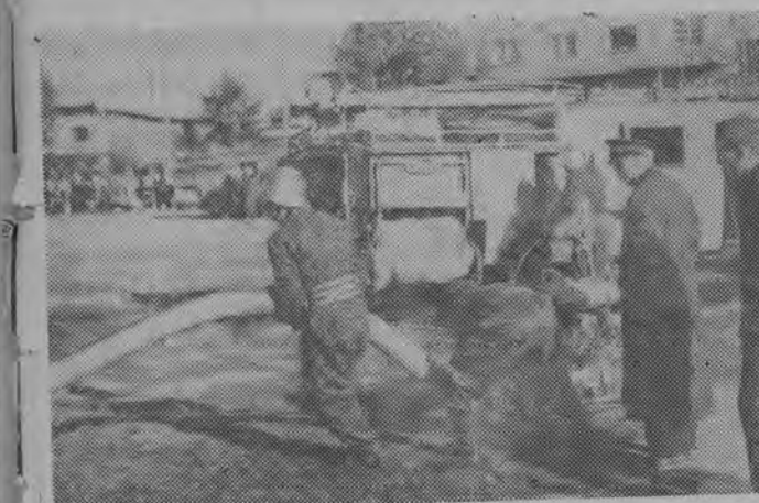
Szybkość w rozładunku wody i uruchomieniu motopompy zdecydowała o zwycięstwie.