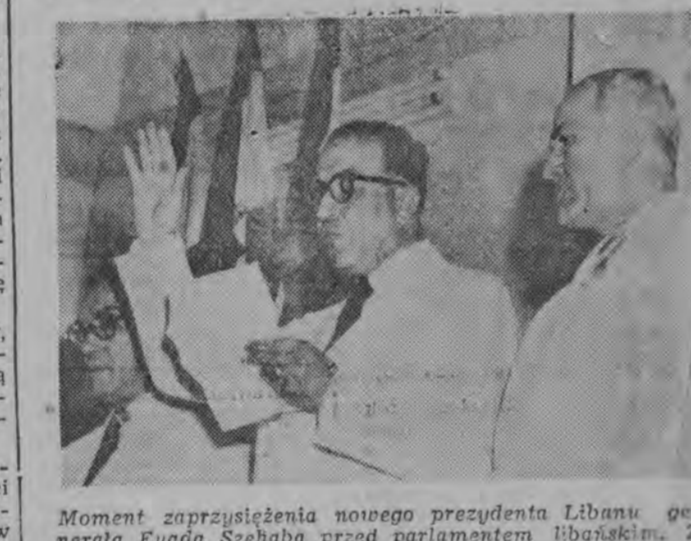
Moment zaprzysiężenia nowego prezidenta Libanu...

Na zesnastu stronach czasopisma znajdującej publikacji i utworów. Oto niektóre z publikacji: