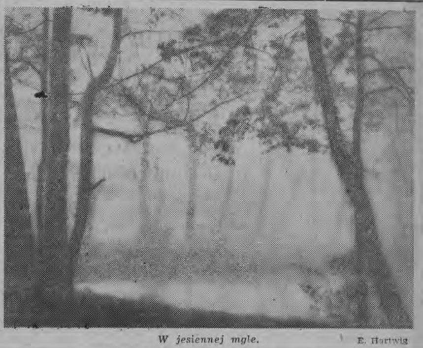
W jesiennej mgle.

o w istniejących spółdzielniach produkcyjnych nastąpiła pewna stabilizacja.