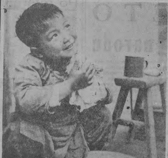
9 lat temu — 1 października 1948 roku proklamowana została Chińska Republika Ludowa. Było to wydarzenie przełomowe zarówno w dziejach Chin, jak i na skalę światową. Dziś, jak co roku 600-milionowy naród chiński obchodzi swoje święto narodowe. Artykuł na ten temat zamieszczamy na str. 2.