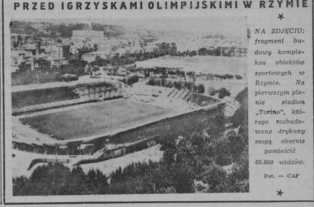
PRZED IGRZYSKAMI OLIMPIJSKIMI W RZYMIE

Oto wyniki spotkań objętych zakładami Totalizatora Sportowego na dzień 27. IX. 1958 r. Birmingham City — Leicester City 4:2, Blackburn Rovers — Aston Villa 2:3, Blackpool — West Ham United 2:0, Bolton Wanderers — Burnley 1:2, Chelsea — Nottingham Forest 4:1, Luton Town — Preston North End 4:1, Manchester City — Manchester United 1:1, Newcastle United — Portsmouth 2:0, Tottenham Hotspur — Wolverhampton Wanderers 2:1, West Bromwich Albion — Everton 2:3, Bristol Rovers — Sunderland 2:1, Middlesbrough — Bristol City 0:0, Sheffield United — Totherham United 2:0,