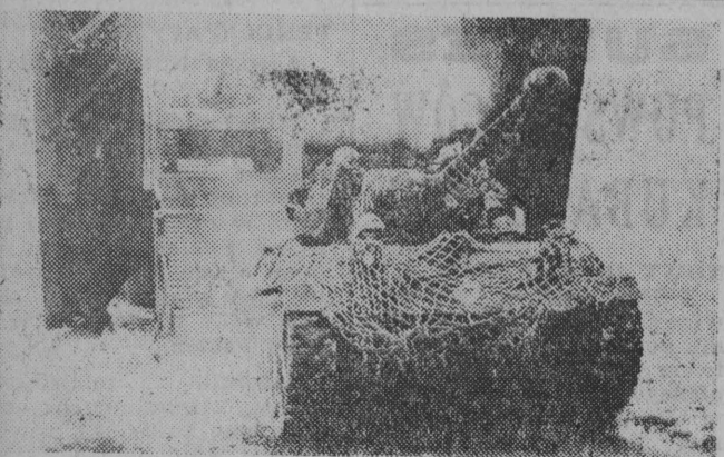
NA ZDJĘCIU: w czasie wspólnych manewrów chińskich wojsk nacjonalistycznych i jednostek amerykańskich.

(Wcześniejsze wiadomości o konflikcie tajwańskim podajemy na str. 2).