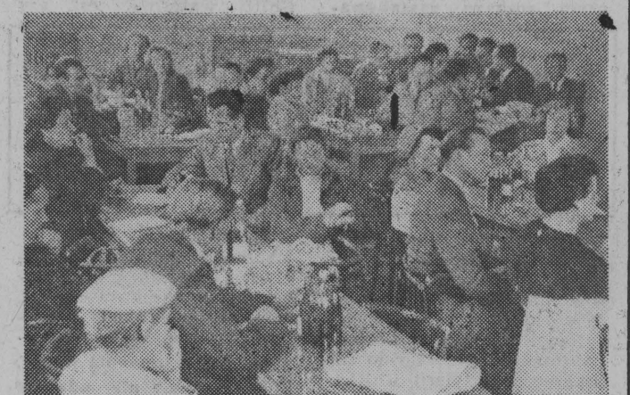
NA ZDJĘCIU: na sali obrad.

wodowe do szczególnego zainteresowania się rozwojem oświaty i kultury w zakładach pracy. Poziom oświaty i kultury robotników stale powinien wzrastać, tak, jak stale wzrastają wymagania, dyktowane przez stały postęp myśli ludzkiej i rozwój techniki. Postulaty wyrażone w dyskusji opracowała Komisja Oświaty i Kultury WKZZ i przełożyła je na konkretny język wytycznych do codziennej pracy w naszych zakładach pracy. (s)