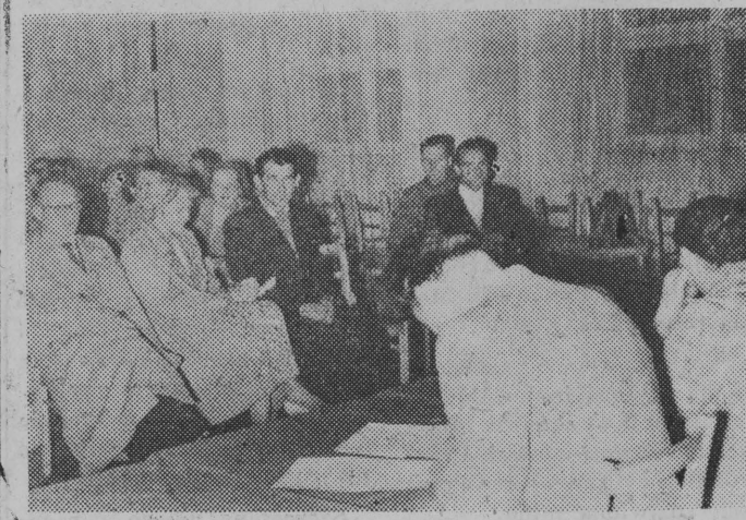
Przedsesyjne zebranie komitetu blokowego.

Z przedsesyjnych zebrań komitetów blokowych