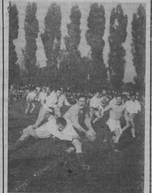
Z międzynarodowego spotkania rugby Polska — NRD w Łodzi — zakończonego zwycięstwem Polski 9:8.