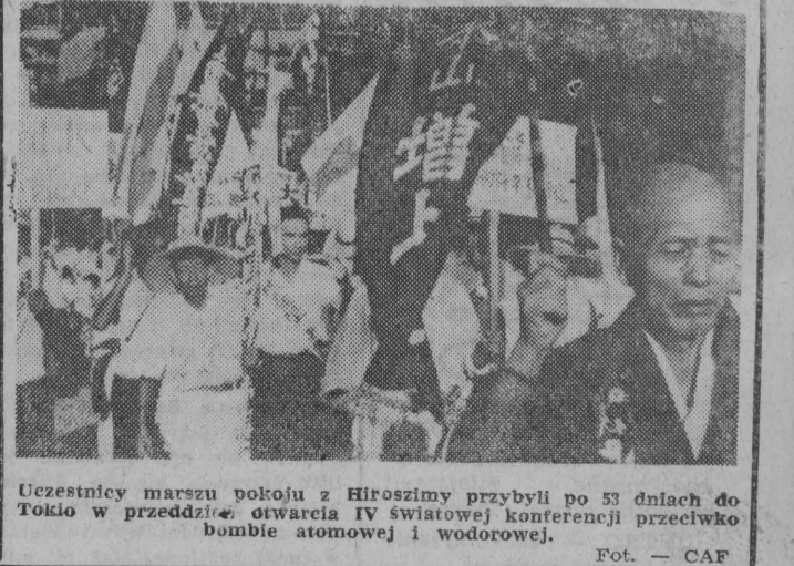
Uczestnicy marszu pokoju z Hiroszimy przybyli po 53 dniach do Tokio w przeddzień otwarcia IV światowej konferencji przeciwko bombie atomowej i wodorowej.

W uchwalonym apelu uczestnicy konferencji wzywają narody całego świata do żądania: 1) niezwłocznego i bezwarunkowego zaprzestania prób z bronią nuklearną, 2) natychmiastowego wycofania wojsk angielskich i amerykańskich z Libanu i Jordanii, 3) zwołania konferencji na najwyższym szczeblu.