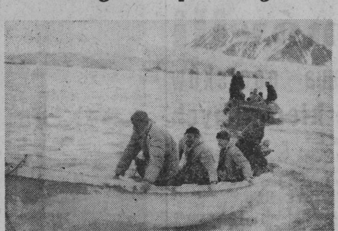
NA ZDJĘCIU: perłusze motorówki z uczestnikami letniej wyprawy arktycznej do białej do brzegu fiordu Hornsund.