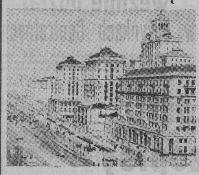
NA ZDJĘCIU: główna ulica Kijowa — Kreszczatik.

Ekada Kultury Polskiej na Ukrainie, która będzie trwała od 8 do 17 bm., stwarza okazję do nowego przypomnienia wizerunku kulturalnej, jaka łączy oba narody.